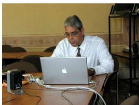
How to improve teaching English #7