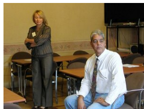
How to improve teaching English #2