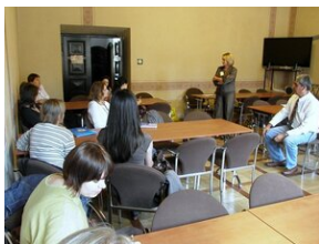
How to improve teaching English #1