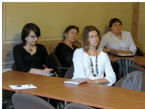
How to improve teaching English #4