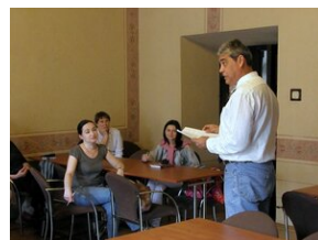
How to improve teaching English #10