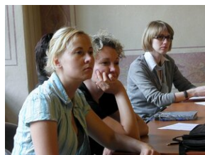
How to improve teaching English #8