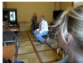
How to improve teaching English #3