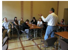
How to improve teaching English #6