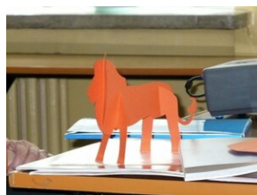
Teachers for Teachers – Practitioners' Forum #2 Małgorzata Tetiurka