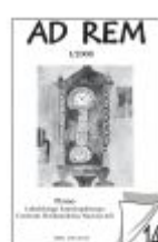
Nr 14 I/2008