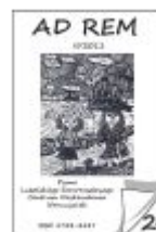
Nr 24 II/2011