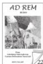
Nr 22 III/2010