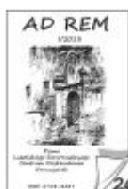
Nr 26 I/2013