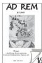
Nr 16 III/2008