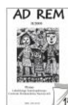
Nr 15 II/2008