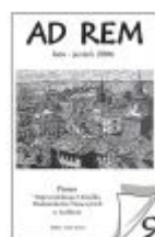
Nr 9 lato-jesień 2006