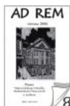
Nr 8 wiosna 2006