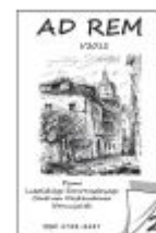
Nr 25 I/2012