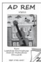
Nr 23 I/2011