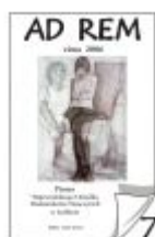
Nr 7 zima 2006