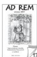
Nr 12 wiosna 2007