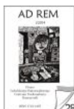
Nr 28 I/2014