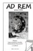
Nr 10 jesień 2006