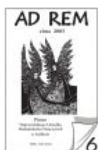
Nr 6 zima 2005