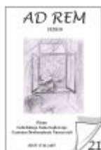
Nr 21 II/2010