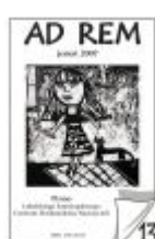
Nr 13 jesień 2007