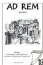
Nr 18 II/2009