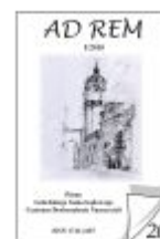
Nr 20 I/2010