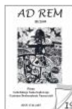
Nr 19 III/2009