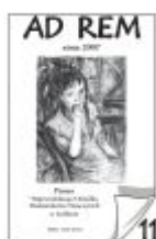
Nr 11 zima 2007