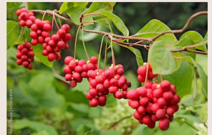
CYTRYNNIK- CYTRYNIEC CHINSKI rodzina cytryńcowate