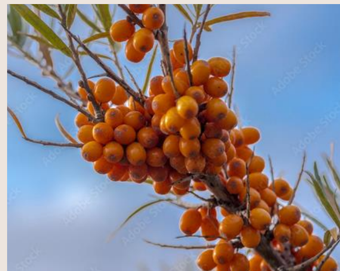
ROKITNIK ZWYCZAJNY rodzina oliwnikowate