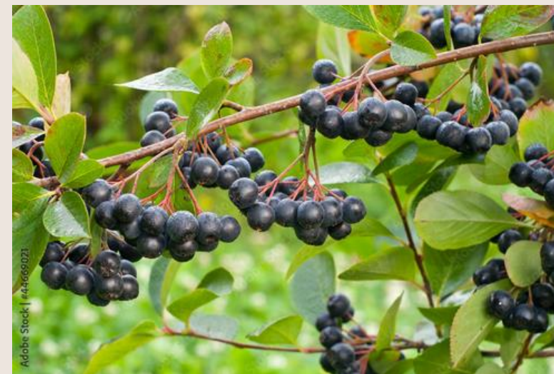
ARONIA CZARNOOWOCOWA rodzina rózowate