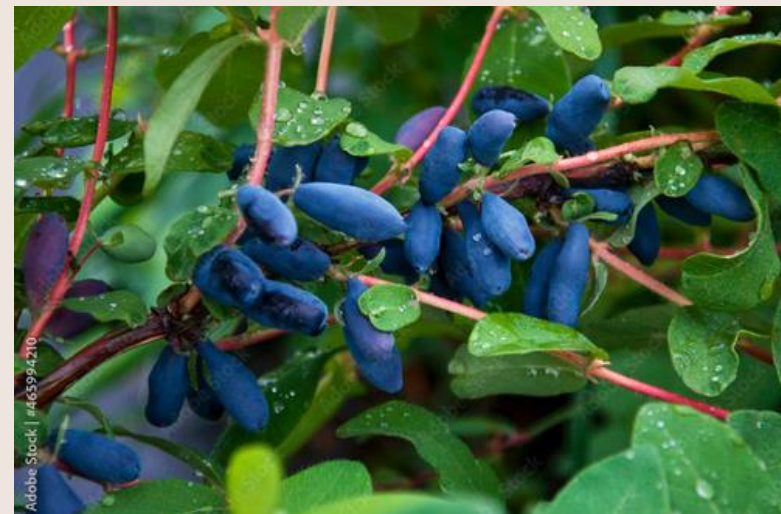
KAMCZACKA JAGODA rodzina przewiertniowate