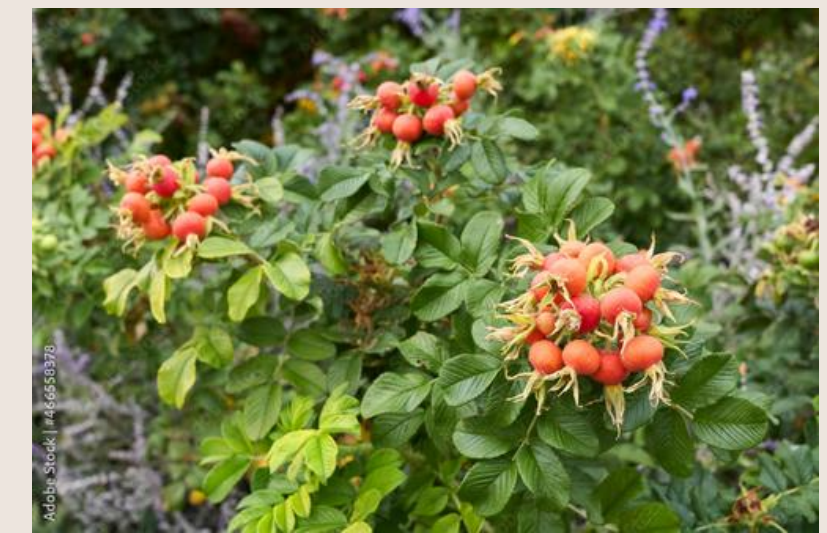
RÓŻA POMARSZCZONA rodzina rózowate