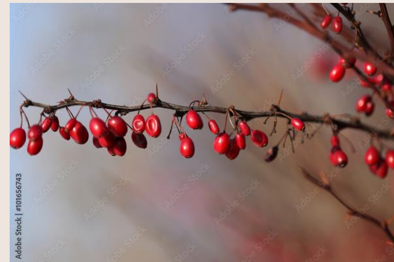
BERBERYS THUNBERGIA rodzina berberysowate