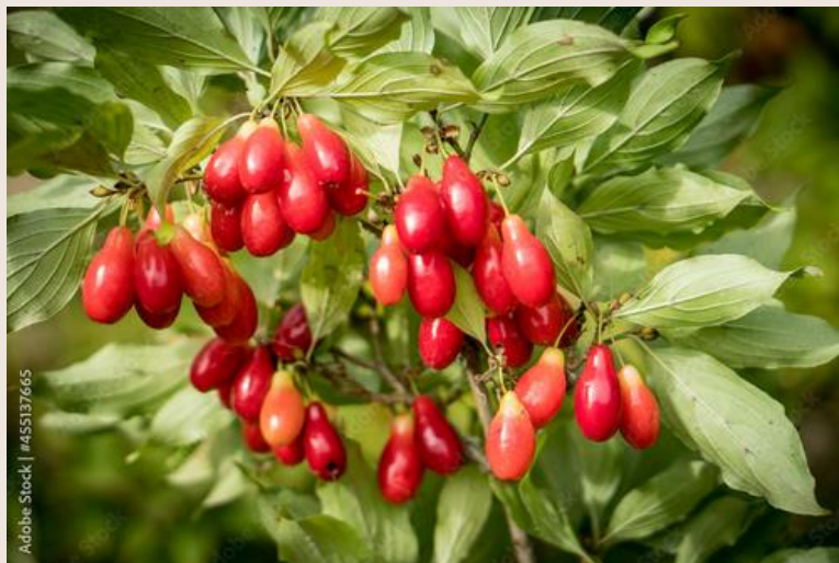
DEREŃ JADALNY rodzina dereniowate