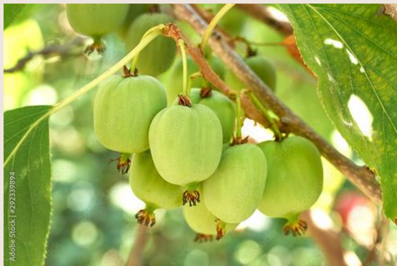
AKTYNIDIA rodzina aktinidiowate