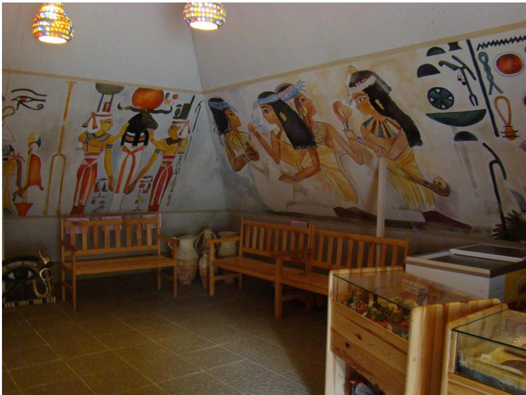
Wnętrze puszczykowskiej piramidy będącej repliką Wielkiej Piramidy Cheopsa, zmniejszonej 23 razy w stosunku do oryginału

Pomieszczenie pod nazwą „Tajemniczy Świat Indian” poświęcone kulturze Azteków, Majów i Inków utworzono w 2003 roku. Panuje tam półmrok i tajemnicza atmosfera.