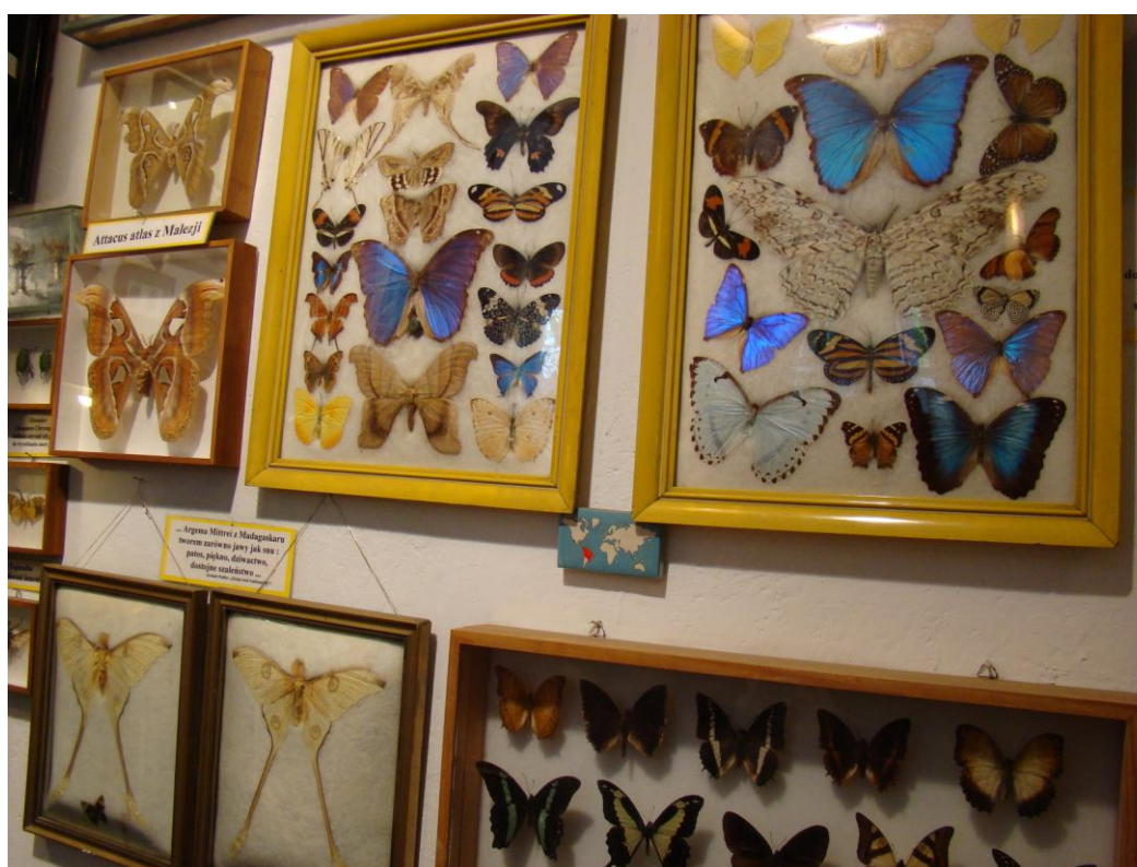
W muzeum zachwyca duża kolekcja motyli, którą stworzył Arkady Fiedler podczas swoich pobytów w Ameryce Południowej, Azji, Afryce oraz na egzotycznych wyspach

W Ogrodzie Kultur i Tolerancji wokół muzeum powstała unikalna na skalę Europy kolekcja rzeźb stanowiących wierne kopie pomników dawnych cywilizacji. Ogród Tolerancji unaocznia wiodącą myśl Muzeum, że odmienne kultury mogą pokojowo istnieć obok siebie i wspierać się wzajemnie. Puszczykowski Sfinks jest jednym z filarów tego „kulturowego ekumenizmu”.