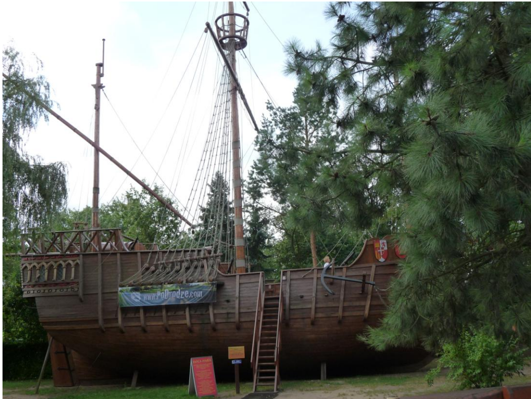
Od 2008 roku w ogrodzie stoi Santa Maria, replika legendarnego żaglowca Krzysztofa Kolumba w skali 1:1

Statek odkrywcy Ameryki Krzysztofa Kolumba jest symbolem nie tylko Wielkiej Przygody, ale także otwarcia na świat, przełamywania trudności i schematyzmu myślenia, poszerzania ludzkich horyzontów.