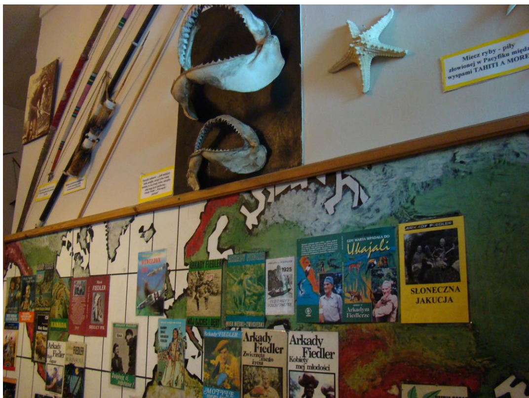
Podróżnik odwiedził m.in. Meksyk, Indochiny, Brazylię, Madagaskar, kilkakrotnie Afrykę Zachodnią

W muzeum zgromadzono pamiątki z licznych wypraw Arkadego Fiedlera. W centralnym miejscu można podziwiać kolekcję książek autora i ich wielojęzycznych wydań. Cały parter stuletniej willi, wystawowy pawilon obok i kilka pomieszczeń w podziemiach eksponują wytwory sztuki różnych ludów, rzeźby i maski obrzędowe, instrumenty muzyczne, broń indiańską i murzyńską, trofea z ludzkich głów – wrogów plemienia (preparowane przez Indian Hibarów), a także inne osobliwości. Obejrzeć można także żywe skorpiony, pająki ptaszniki, boa dusiciela oraz żywe piranie.