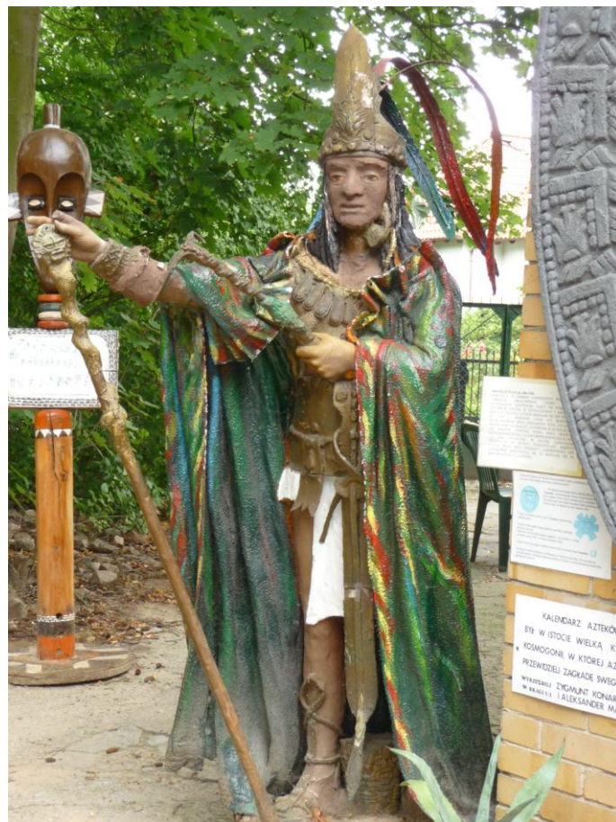
Do wnętrza sal zapraszającym gestem drogę wskazuje Montezuma II - władca Azteków