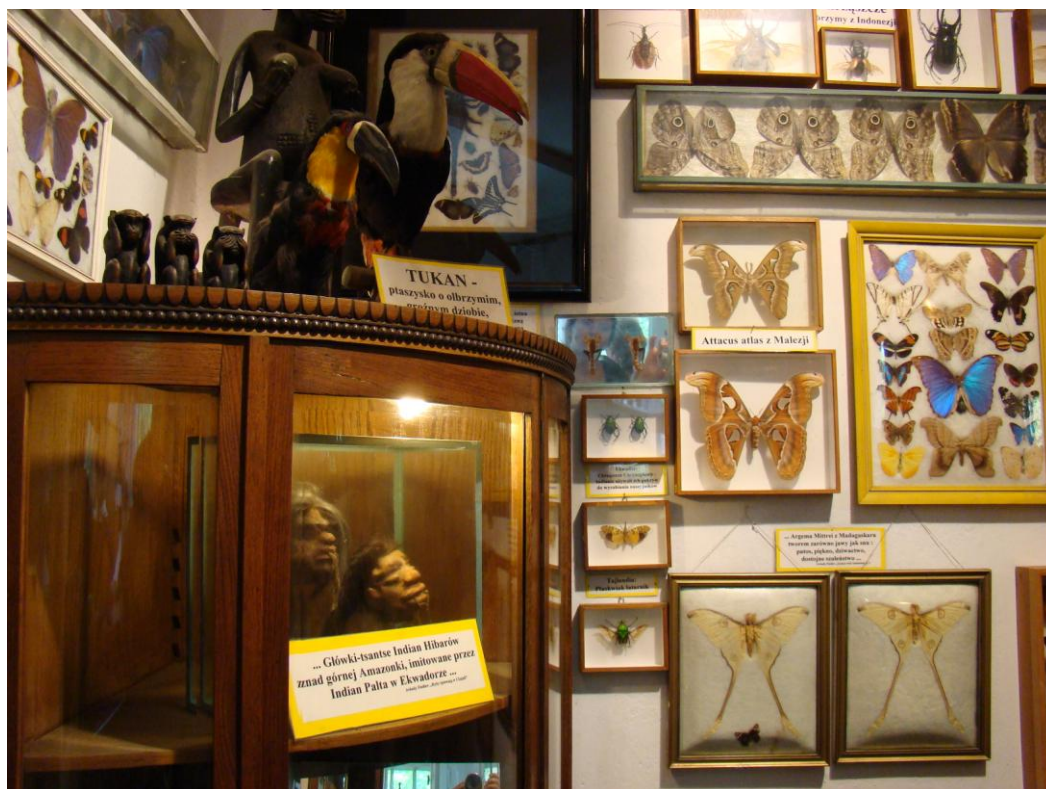
Główki-tsantse Indian Hibarów znad górnej Amazonki, imitowane przez Indian Palta w Ekwadorze