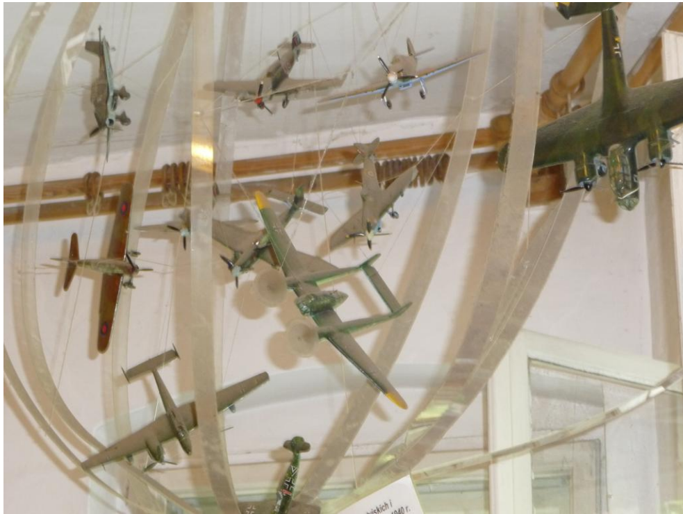
Specyficzna pamiątka odwołująca się do pobytu Arkadego Fiedlera w Anglii w bazie Dywizjonu 303 w pod londyńskim Northolt w 1940 i 1941 roku