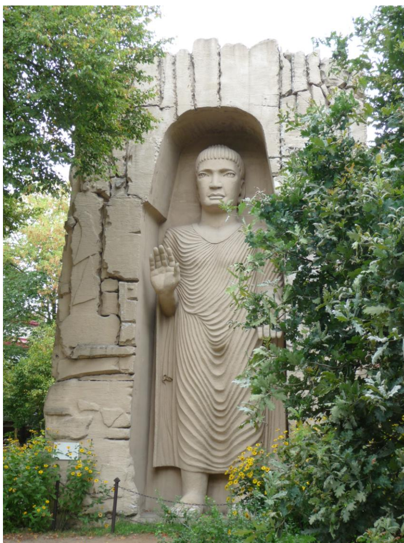
Budda - rzeźba Andrzeja Biernackiego

W 2003 roku w Ogrodzie Tolerancji powstała kopia (w skali 1:9) największego stojącego Buddy (53 m), posągu z doliny Bamjan w Afganistanie. Został on doszczętnie zniszczony przez talibów w 2001 roku. Budda w Muzeum-Pracowni to wyraz niegodzenia się na akty barbarzyństwa oraz braku tolerancji wobec innych kultur i religii.