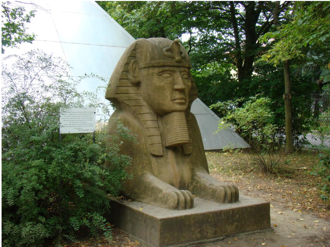
W 2002 r. wybudowano pomniejszoną replikę Sfinksa, inspirowanego wielkim Sfinksem z Gizy pod Kairem