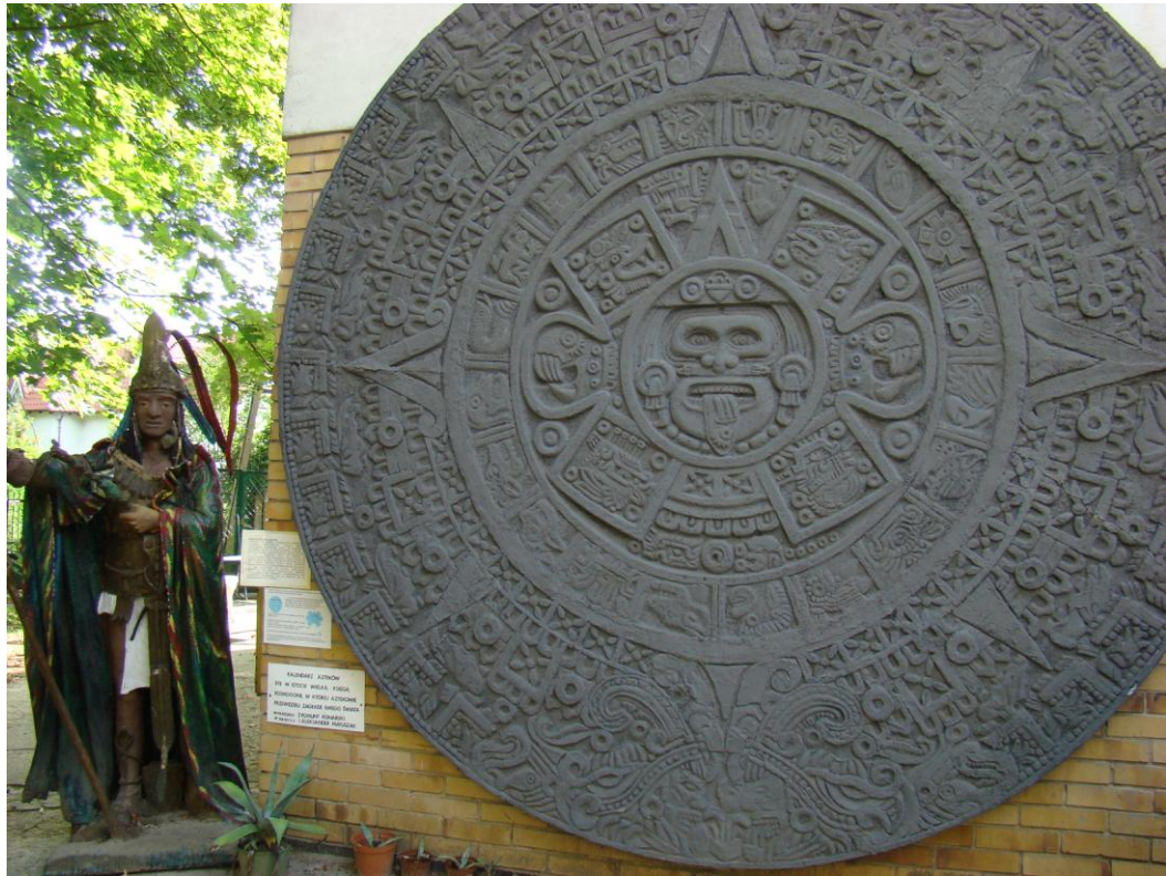
Kalendarz Azteków w kształcie wielkiego dysku