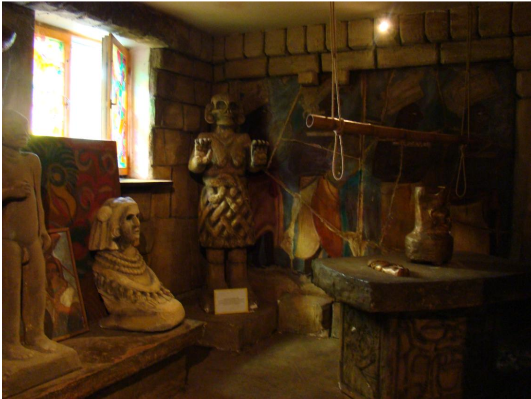
Sala wypełniona jest indiańskimi postaciami, malowidłami i symbolami