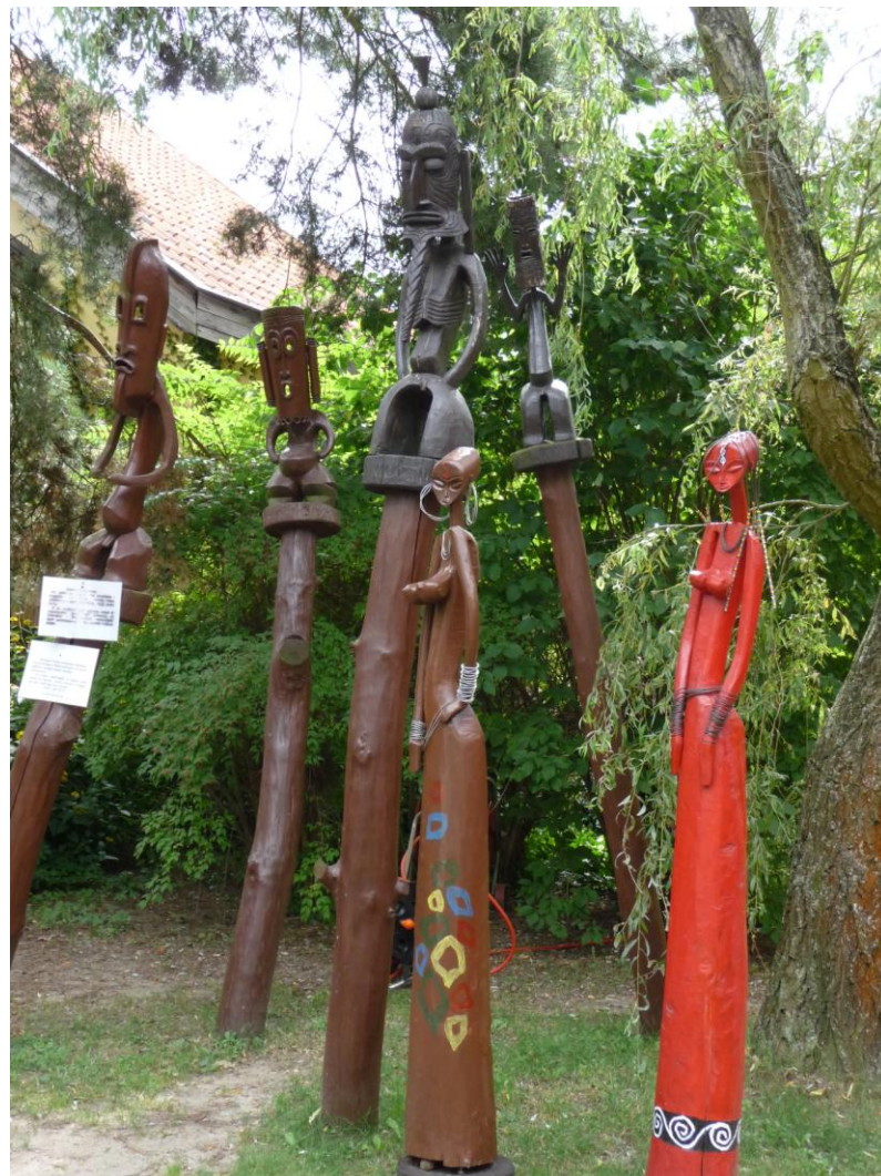
„Piętkości afrykańskie” – eksponaty nawiązujące do sztuki Czarnego Łądu