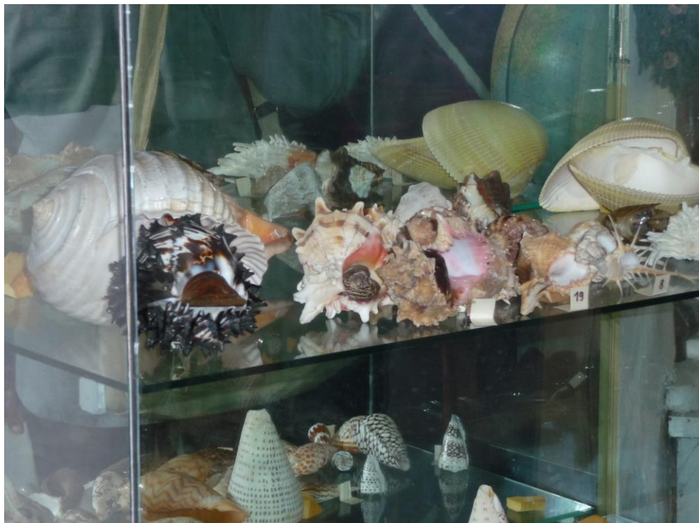
Podróżnik przywiózł ze swoich wypraw bogate zbiory zoologiczne i botaniczne

W muzeum organizowane są czasowe wystawy podróżnicze, przyrodnicze oraz inne.