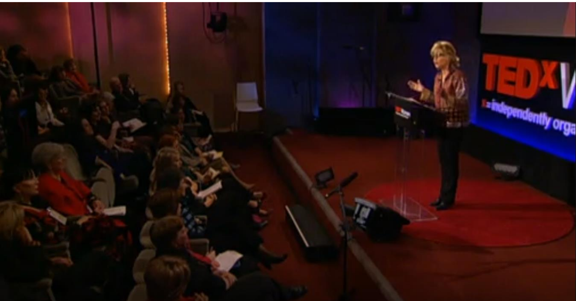
2011-12 TEDx Woman Jane Fonda „ Trzeci akt życia ” (video 11:08)