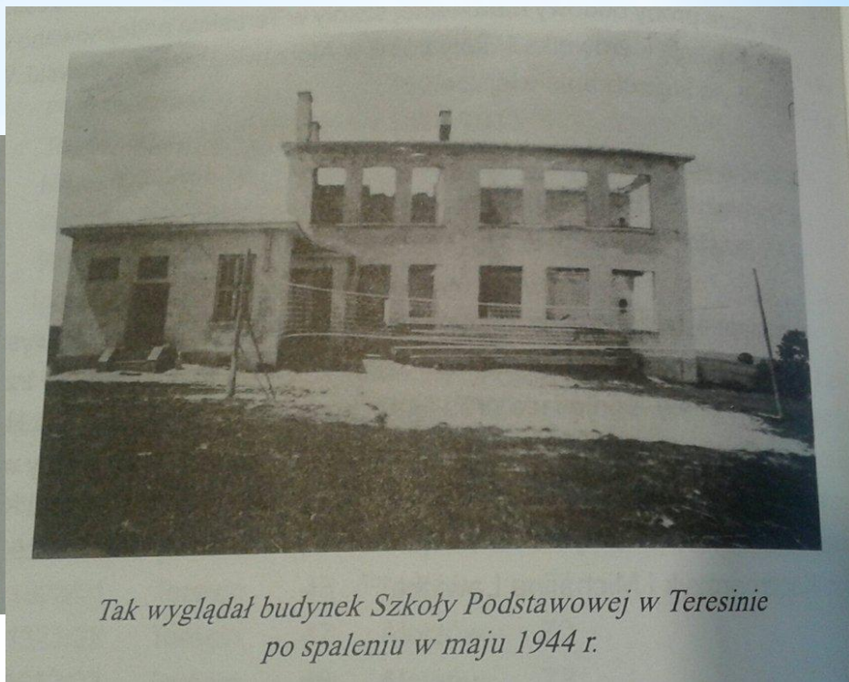
Tak wyglądał budynek Szkoły Podstawowej w Teresinie po spaleniu w maju 1944 r.

„Cudze chwalicie, swego nie znacie...” Historia Szkoły Podstawowej w Teresinie od 1916 r.